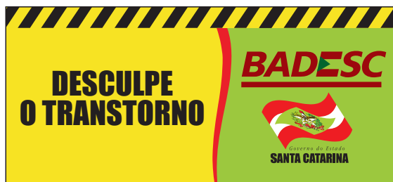
Cavalete de Obra